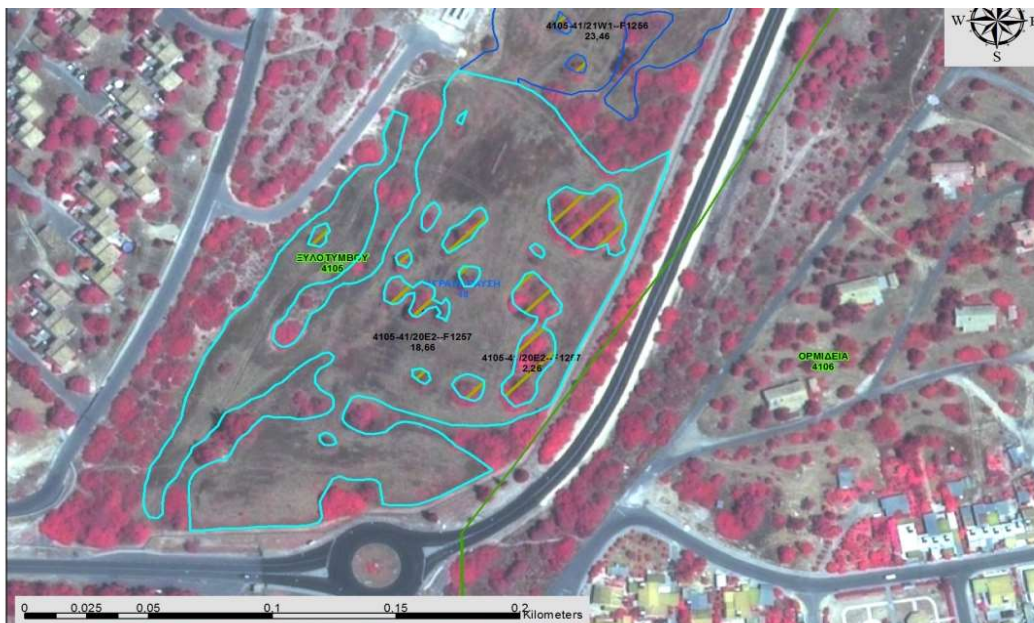
Εικόνα 3. Παράδειγμα με κομμάτι του τεμαχίου (ξεχωρίζει η αροτραία καλλιέργεια από τα δέντρα)

«συμπαγή φυτεία δέντρων». Σε τέτοια περίπτωση δηλώνεται το εν λόγω αγροτεμάχιο με τη δενδρώδη καλλιέργεια πχ. ελιές και δηλώνεται και ο αριθμός των δέντρων.