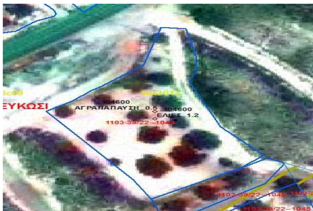
Εικόνα 2. Παράδειγμα με δέντρα που ολόκληρη η έκταση υπολογίζεται ως μόνιμη καλλιέργεια (17 δέντρα – ΜΕΕ =1.6 Δεκάρια)

Σε περίπτωση που μια έκταση θεωρηθεί σύμφωνα με τα πιο πάνω σαν « αρόσιμη γη με διάσπαρτα επιλέξιμα δέντρα » τότε θα πρέπει να δηλώνεται σύμφωνα με τον πιο πάνω διαχωρισμό, δηλώνοντας την καλλιέργεια και τον αριθμό διάσπαρτων δέντρων που υπάρχει στο αγροτεμάχιο ανάλογα με τη δήλωση.