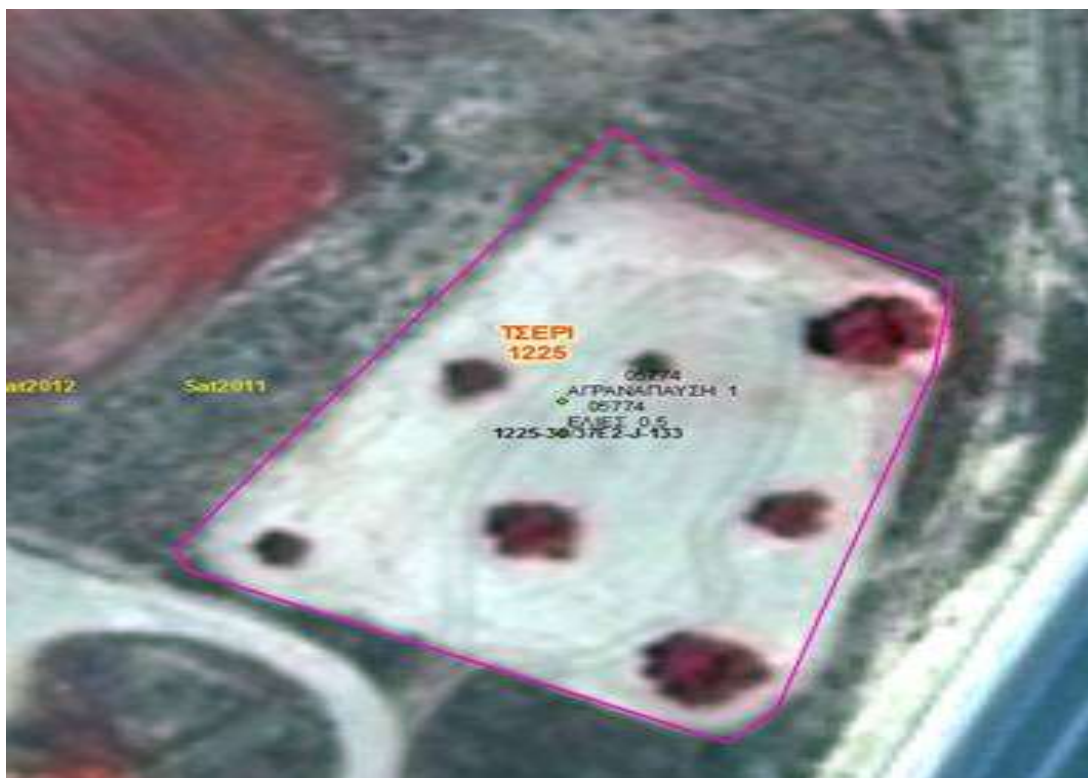
Εικόνα 1. Παράδειγμα με διάσπαρτα δέντρα που ολόκληρη η έκταση υπολογίζεται ως αρόσιμη (7 δέντρα – ΜΕΕ=1.5 Δεκάριο)